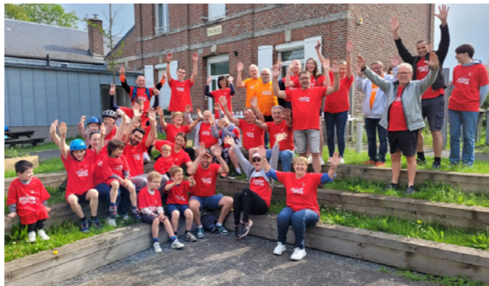
La rando39 a eu lieu le 19 mai.