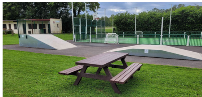
L'installation d'une table au stade.