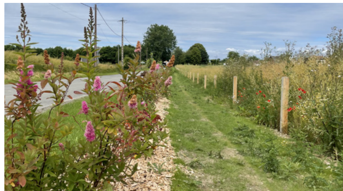
La réalisation d'un engazonnement sur le sentier le long de la rue d'Anjou et la mise en place de plantes