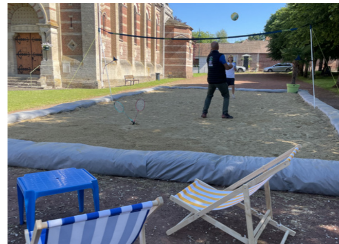
La plage prend ses quartiers place de l'église