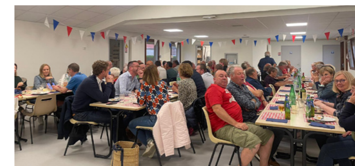
La fête du 13 juillet