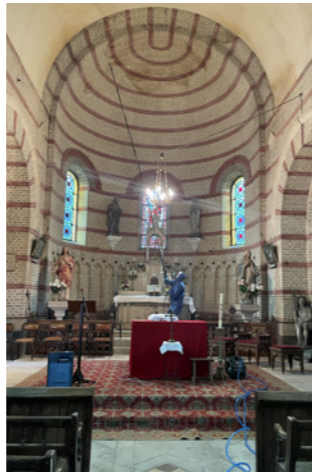
La désinsectisation des mouches dans l'église