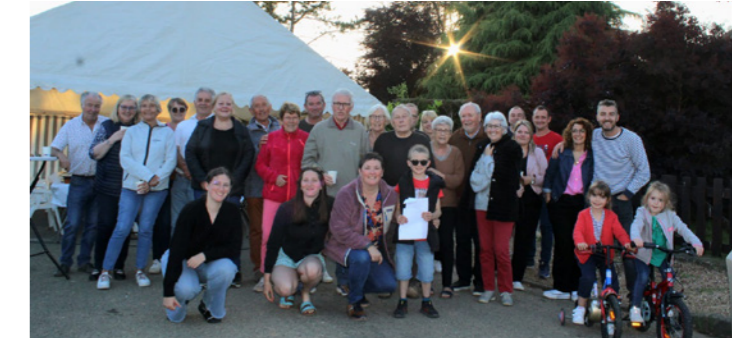
Rue de Beauvoir