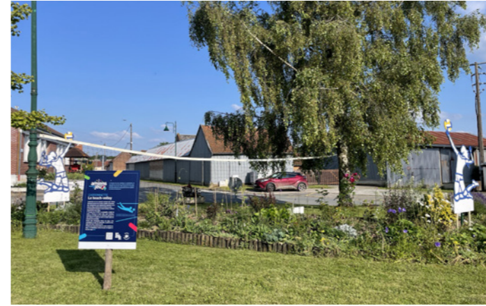
La mise en place des fleurs et des figurines dans le parterre pour les JO. Cardonnette a choisi le Beach Volley