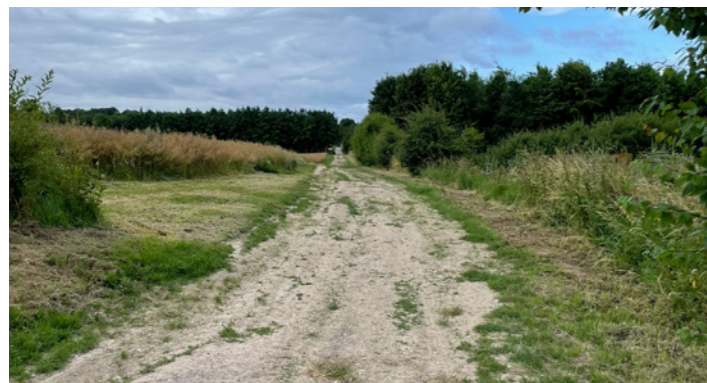
La remise en état du chemin du Prêtre et de la rue d'Alsace