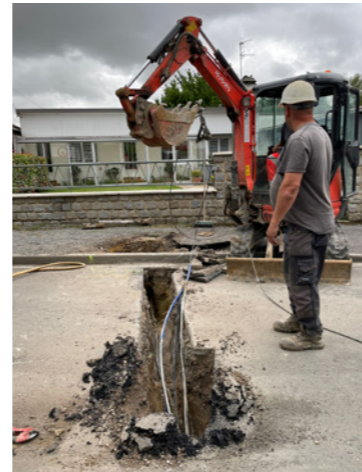
Les travaux sur le réseau d'eau et la voirie rue de Normandie