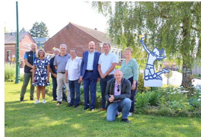
La venue d'Alain Gest, président d'Amiens Métropole pour le fleurissement des JO 2024