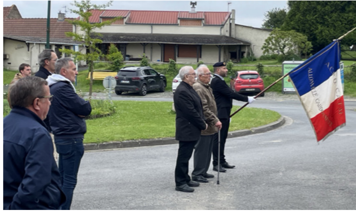
La commémoration du 8 mai 1945