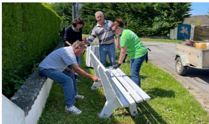
Une petite remise en beauté pour les bancs !