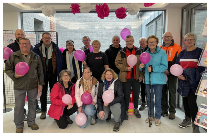
La marche Rose, le 20 octobre