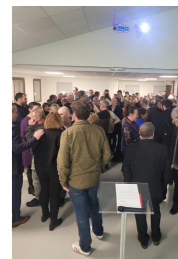
La cérémonie des vœux