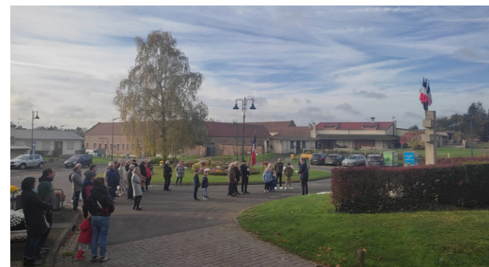
La cérémonie du 11 novembre