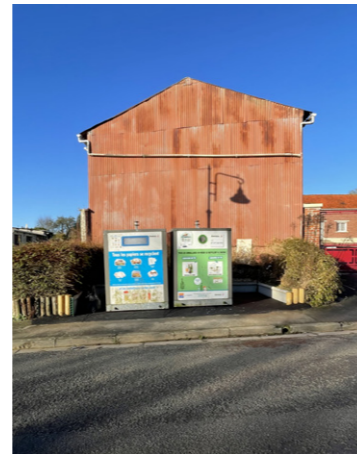
L'aménagement de l'espace pour les verres et cartons