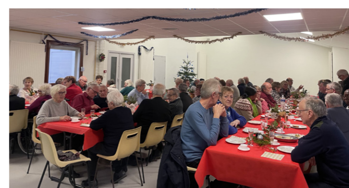
Le Goûter des aînés et la remise des colis