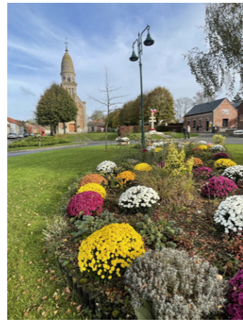
Le fleurissement d'Automne