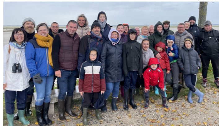
Une journée conviviale en baie de Somme pour les élus municipaux de Cardonnette