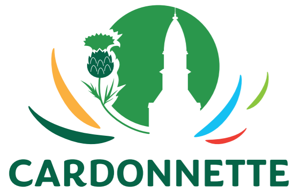
Le nouveau logo de la commune