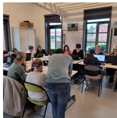
L'atelier Octobre Rose