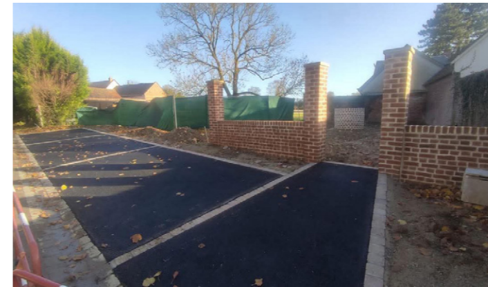
La réalisation de places de parking, place de l'église