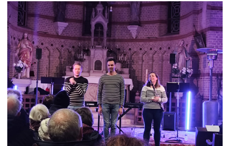
Le concert dans l'église