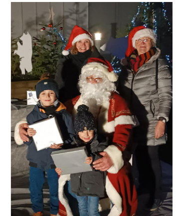
L'arbre de Noël des enfants