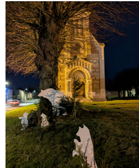
L'installation des sapins et des figurines dans le village