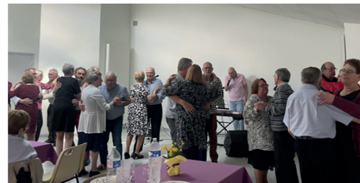
Le repas des Aînés