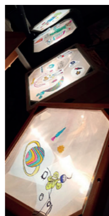
L'atelier rétro mapping avec le Safran