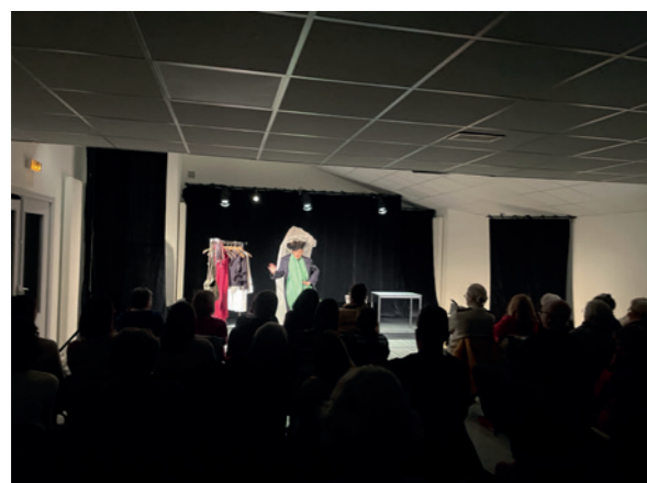
Le théâtre Euphrate avec la Comédie de Picardie