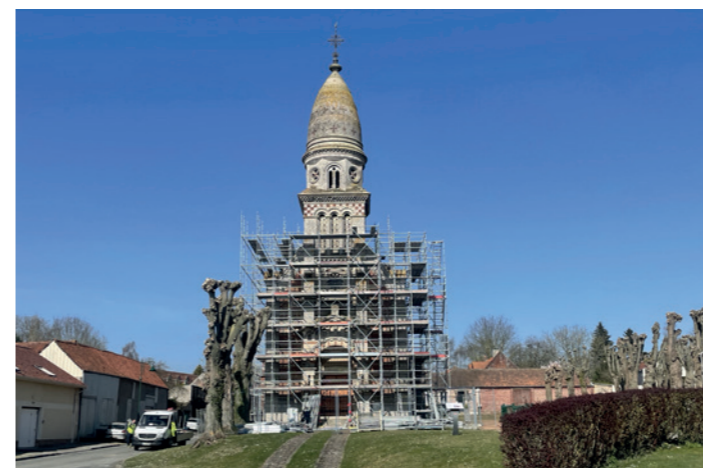
La mise en place de l'échafaudage pour les travaux de l'église