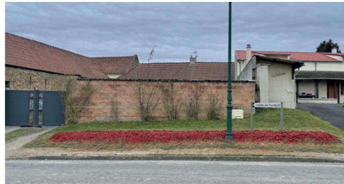
Le nouveau parterre de rosiers au centre du village