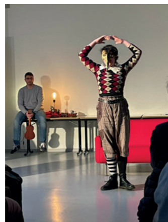
La restitution de l'atelier théâtrale