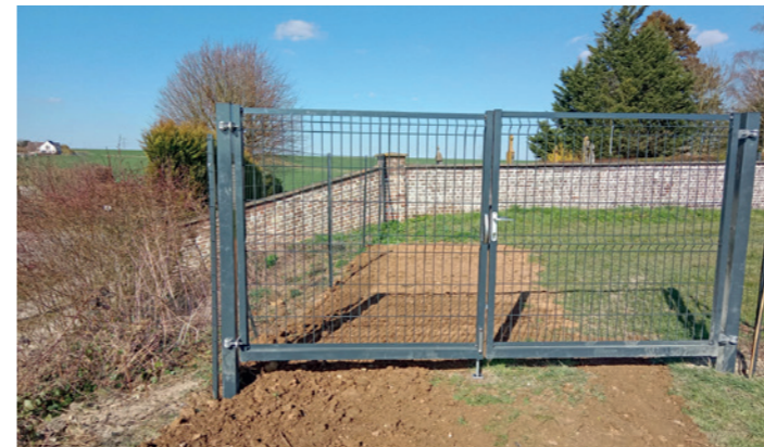
L'installation de la clôture et d'une barrière dans le nouveau cimetière