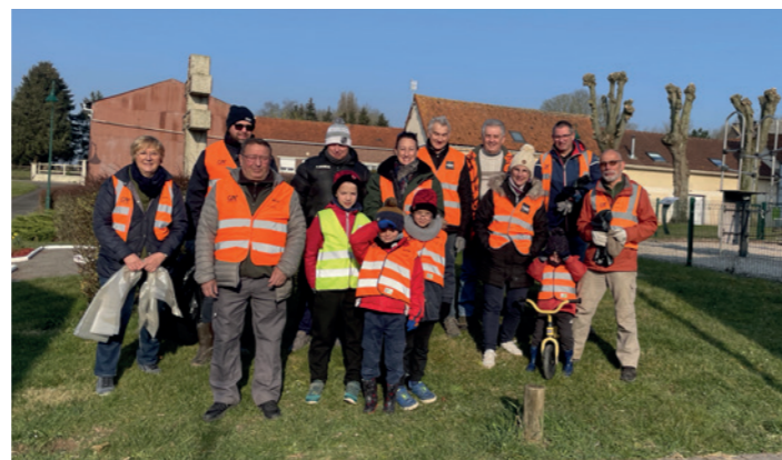
L'opération Hauts-de-France Propres